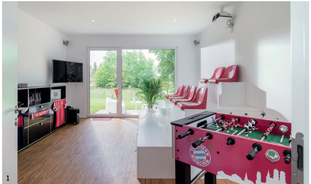
1 Hier schauen Vater Kim und Sohn Paul mit Freunden auf großer Leinwand jedes Champions League- und DFB-Pokalspiel 2 Das Farbkonzept wurde auch im Hausinneren konsequent beibehalten: Weiß und Grau werden hier in ausgewogenem Verhältnis mit massivem Holz kombiniert 3 Große Glasschiebetüren erfüllen die Räume mit viel Tageslicht und erweitern den Wohnraum zur Terrasse und in den großen, umliegenden Garten.

Auch die privaten Rückzugsräume sind echte Wunscher-