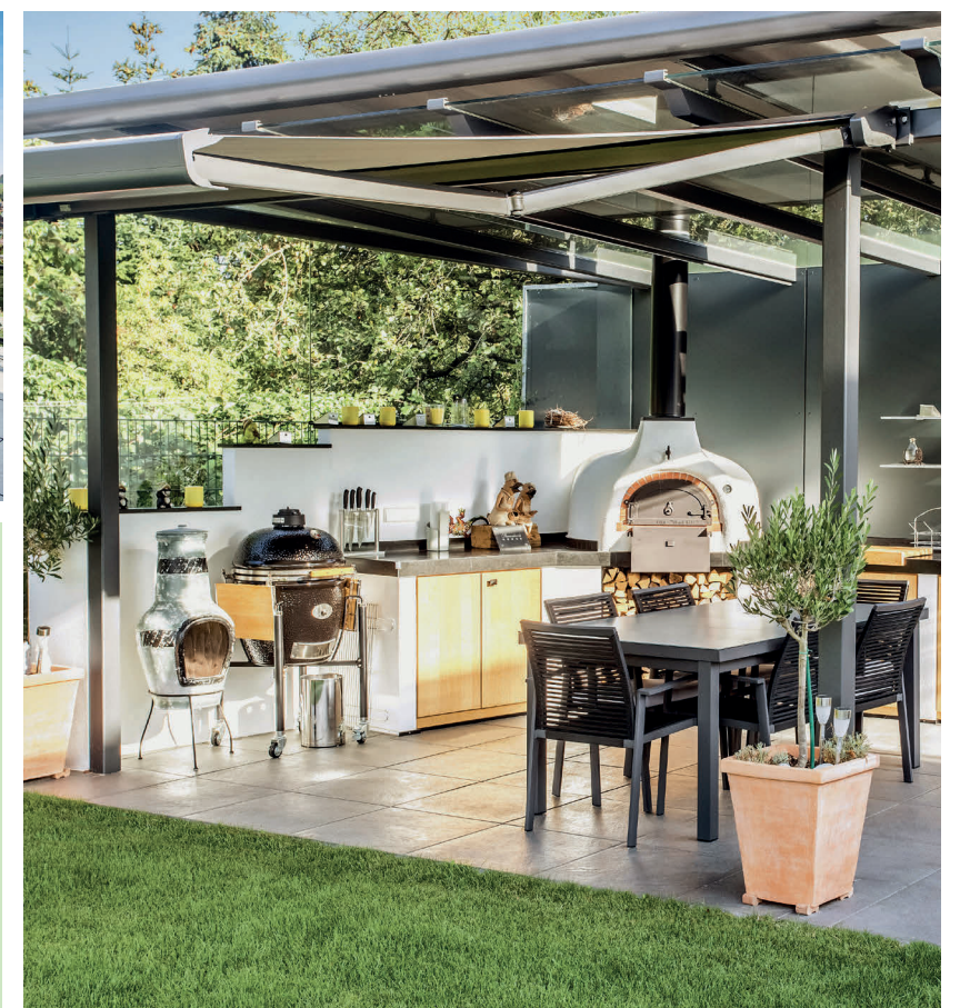
Rechts: Für Grillabende gibt es im Garten ein lauschiges Plätzchen unter einem Dach – mit voller Ausstattung.