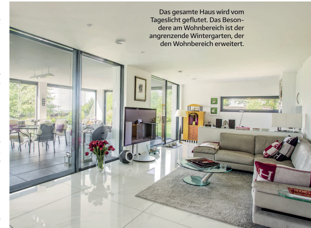
Das gesamte Haus wird vom Tageslicht geflutet. Das Besondere am Wohnbereich ist der angrenzende Wintergarten, der den Wohnbereich erweitert.

Die Hausplanung für das individuelle Architektenhaus erfolgte zügig, das Paar wusste genau, was es wollte. So wurden Raumaufteilung und Größenordnung von dem vorherigen Haus in Stuttgart übernommen. Ziemlich clever – denn so passten die vorhandenen Möbel perfekt in das neue Eigenheim. Allerdings erinnert das jetzige Domizil kein