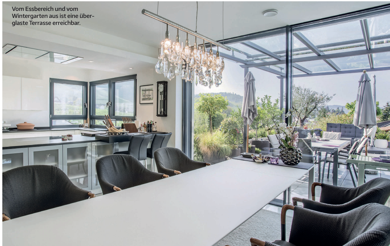
Vom Essbereich und vom Wintergarten aus ist eine überglaste Terrasse erreichbar.