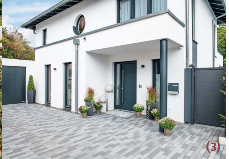
(1) Sie sollte kleiner als das ehemalige Familiendomizil sein und dennoch genügend Platz für den geruhsamen Lebensabend bieten – die neue Stadtvilla des Ehepaars Renner. Das neue Domizil von Weber Haus bietet nun 175 Quadratmeter Wohnfläche. Ein Highlight ist der großzügige Balkon vor dem Schlafzimmer, der zugleich einen Teil der Terrasse überdacht. Der Gartenpool vor dem Haus sorgt für Abkühlung an heißen Tagen und stärkt die Fitness. (2) Das Wohnhaus thront leicht erhöht über dem Straßenniveau. Die Auffahrt gleicht den Höhenunterschied mit einer kurzen, knackigen Steigung aus, damit das Elektroauto der Hausherren zu seiner Garage kommt, davor aber auch noch ein Stellplatz für Gäste zur Verfügung steht. (3) Ein schlankes Vordach beschützt den Eingangsbereich und geht nahtlos in die Stauräume über.

I rgendwann ist es immer so weit: Die Kinder gehen ihre eigenen Wege und ziehen aus. Zurück bleibt dann meist ein stilles Haus mit vielen ungenutzten Quadratmetern. Evelin und Frank Renner wollten sich mit dieser Situation aber nicht abfinden. Als das letzte ihrer vier Kinder das 400 Quadratmeter große Einfamilienhaus verließ, verkauften sie die Immobilie kurzerhand, um noch einmal neu zu bauen. „Der Verkauf war eine sehr gute Entscheidung, allein schon aufgrund der hohen Energiekosten“, berichtet Evelin Renner.